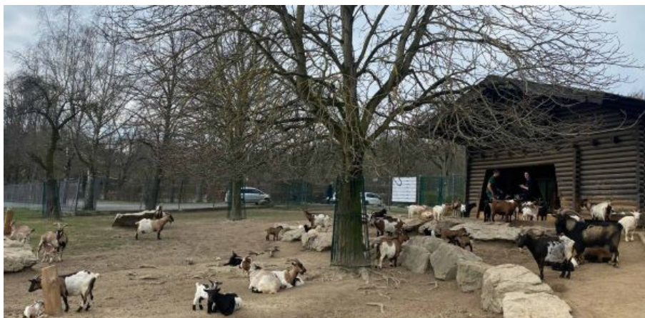
Afrikanische Zwergziegen beim Chillen in der Sonne

Bleiben Sie gesund und dem Opel-Zoo und seinen Tieren treu!